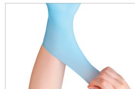
▲ 縦にも横にもよく伸びる素材